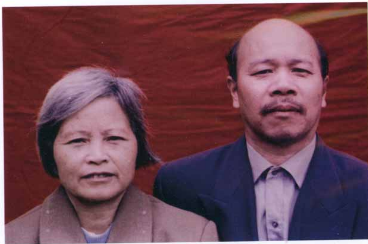
广东省紫金县车洞村远辉先生夫妻玉照 捐款陆仟伍佰元