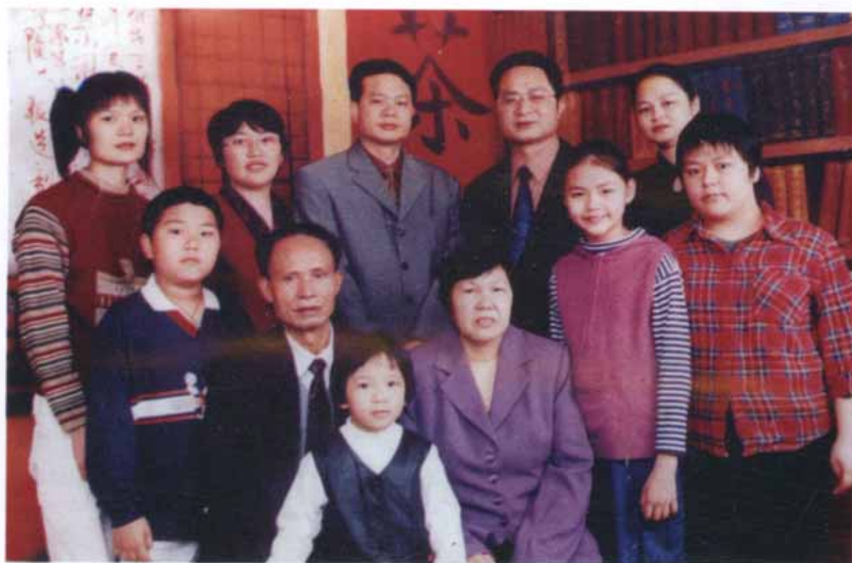
广东省河源市麻竹坑水发先生全家福玉照 捐款叁万元