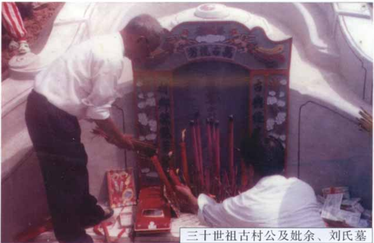
三十世祖古村公及妣余、刘氏墓