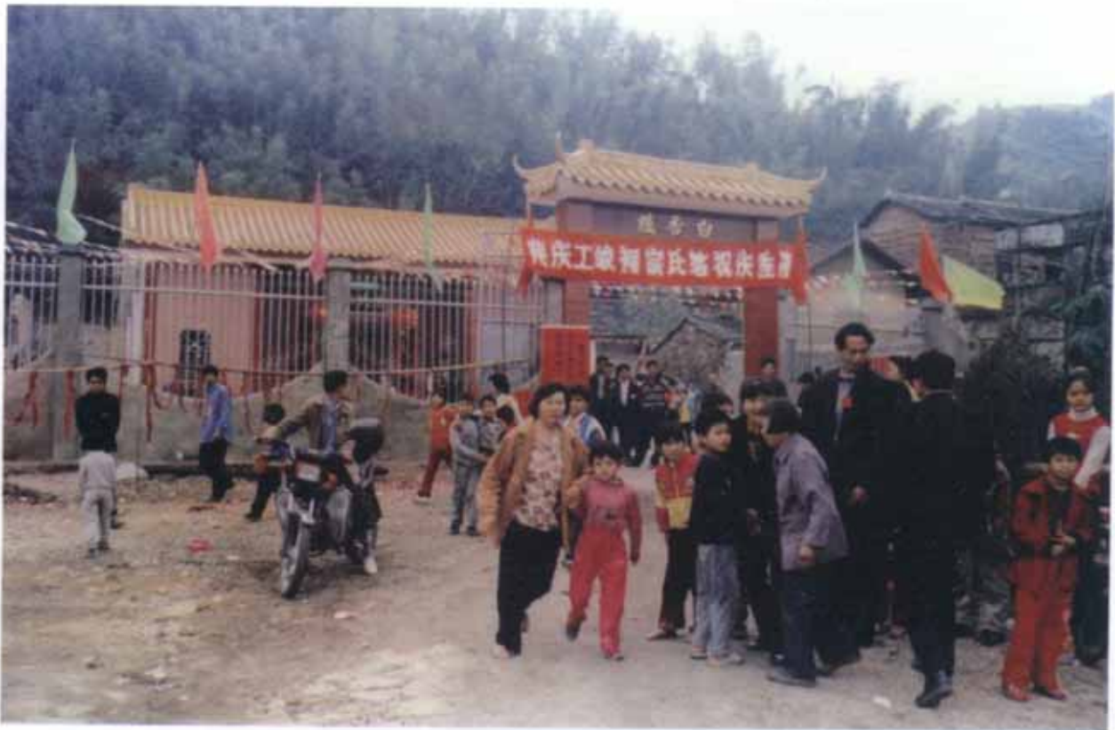
广东省兴宁市黄陂镇甘专村练氏宗祠白香炉门楼