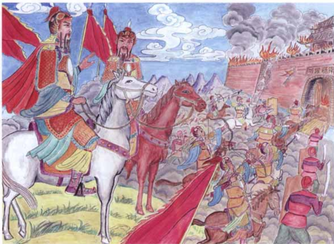
东何公焚城建功画像