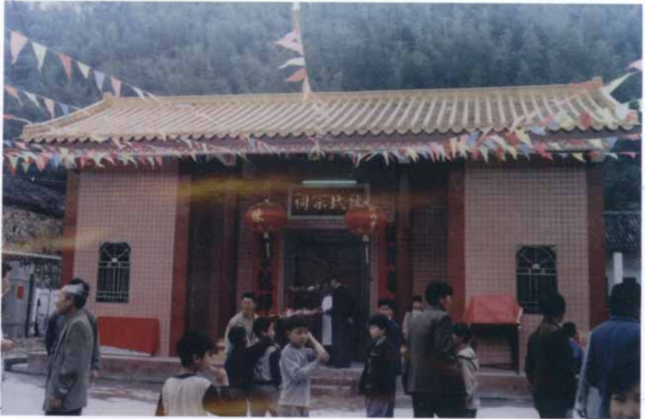
广东省兴宁市黄陂镇甘专村开基始祖元龙公祠