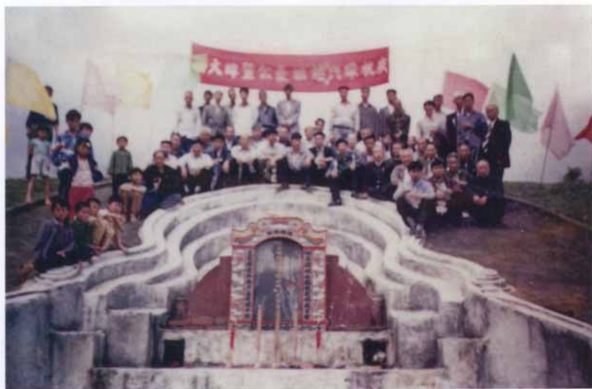
福建省武平县象洞乡洋贝开基始祖豪公妣李、张氏墓