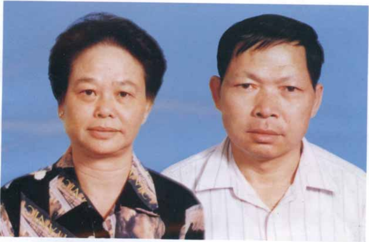
广东省惠东县白花镇（香港）镇洋先生夫妻玉照 捐款陆仟元