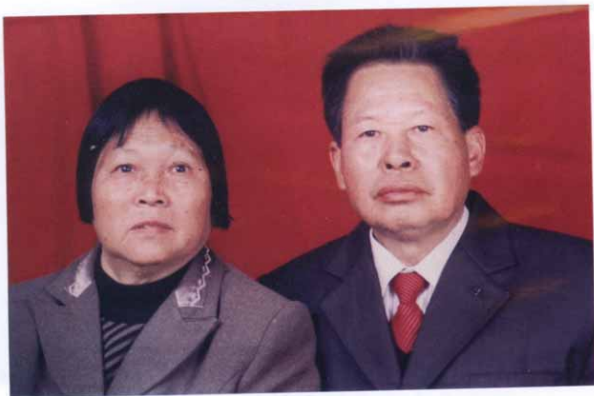
广东省兴宁甘专汉忠先生夫妻玉照 捐款陆仟元