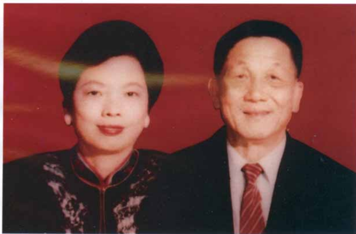
广东省兴宁甘专（台籍）炳贵先生夫妻玉照 捐款壹万元