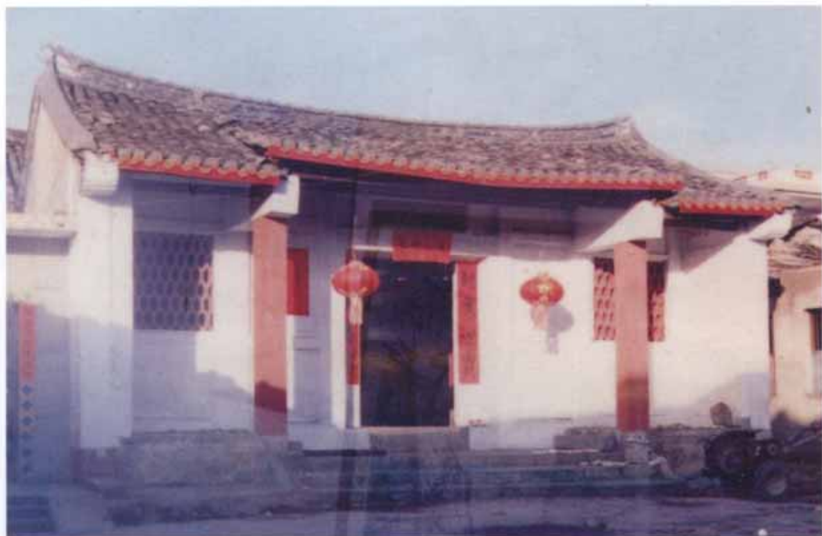
福建省武平县岩前镇豪公总祠练氏家庙