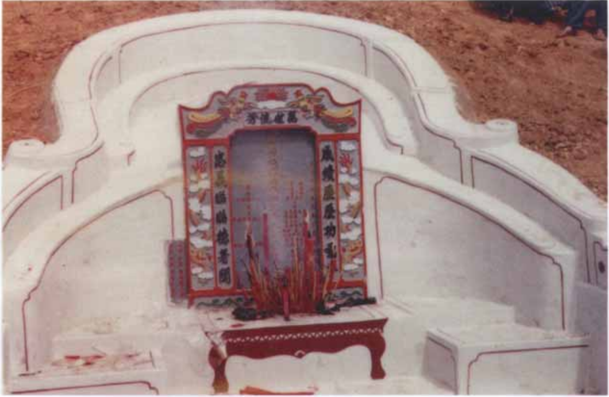
福建省武平县象洞乡洋贝村二世祖成忠公妣钟氏墓