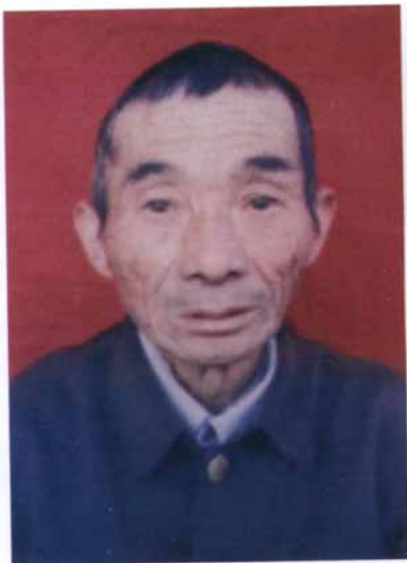
兴宁甘专佰春先生玉照 捐款叁仟元