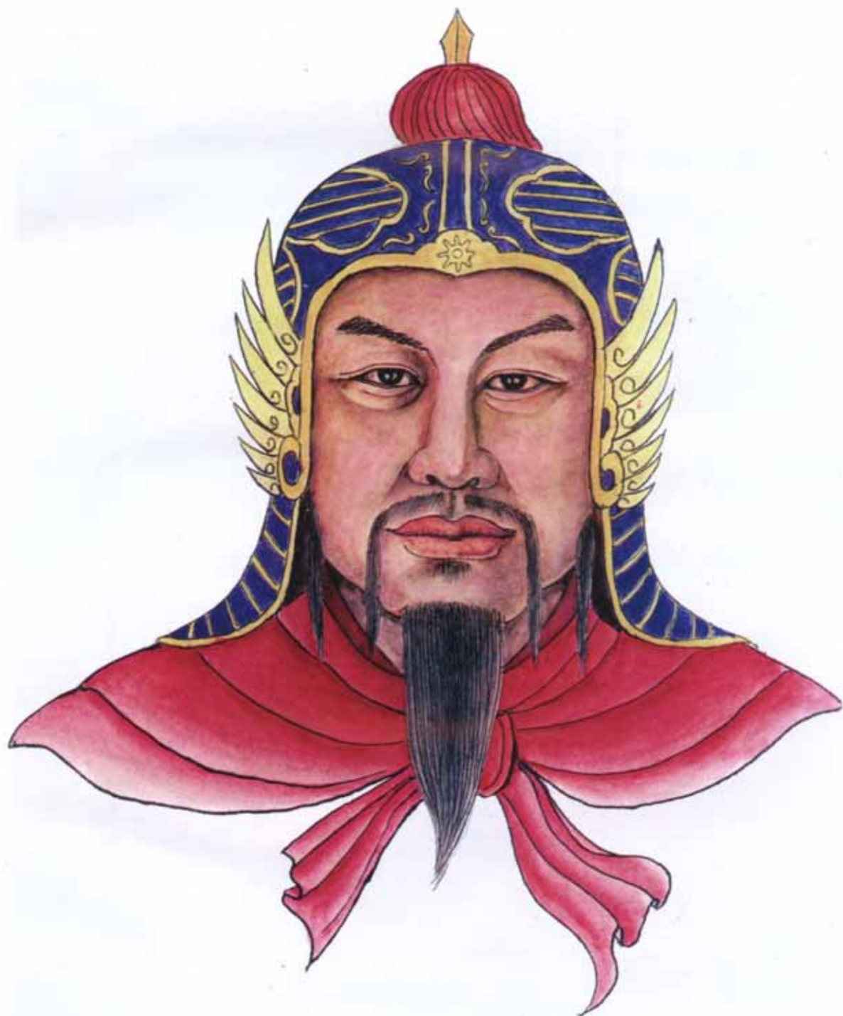
河南省賜姓始祖東何公画像