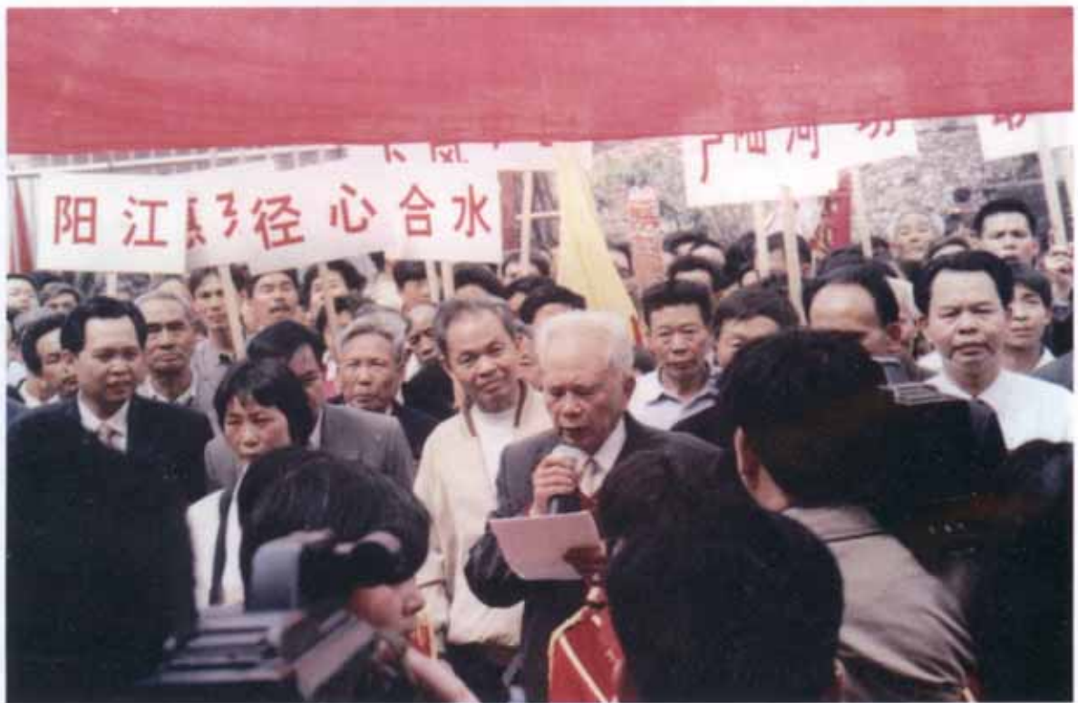
甘专村开基始祖元龙公祠重光庆典致词场面