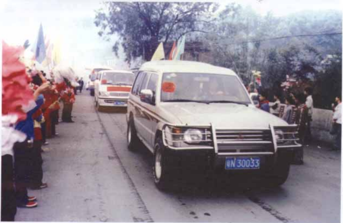
广东省兴宁市黄陂镇甘专村元龙公祠重光庆典癸未二月十三日盛况。上图为各地宗亲参加庆典车队进村时，甘专宗亲夹道欢迎的热闹场面。