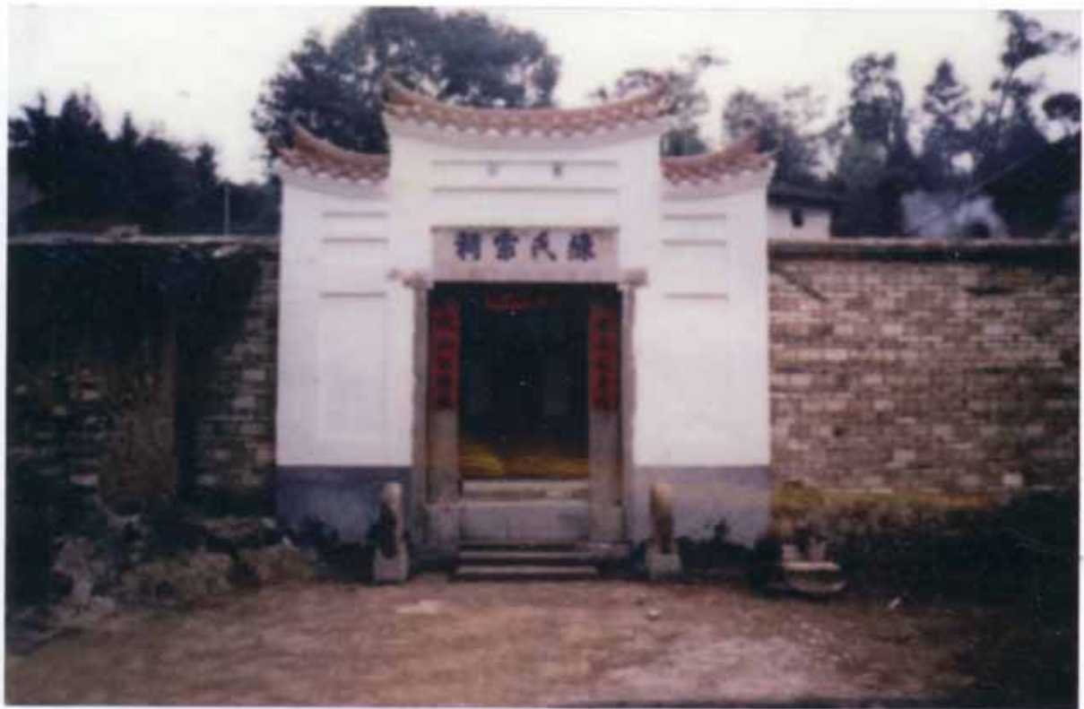
福建省武平县象洞乡洋贝村三世祖古村公祠