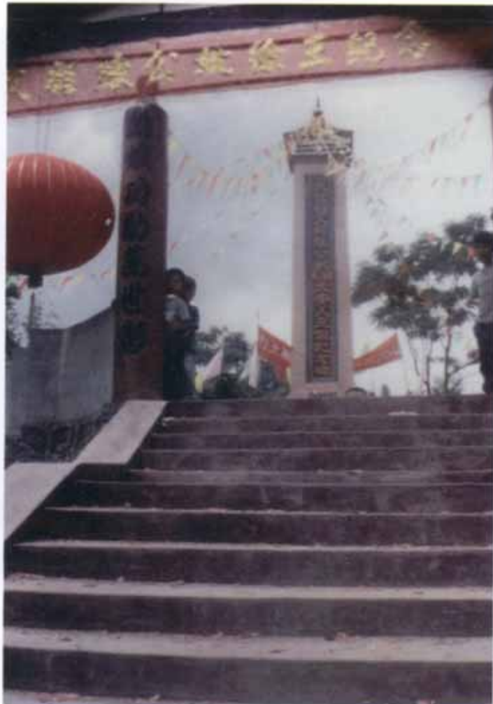
四世祖文彪公妣徐、王氏纪念碑 广东省兴宁市黄陂镇甘专村