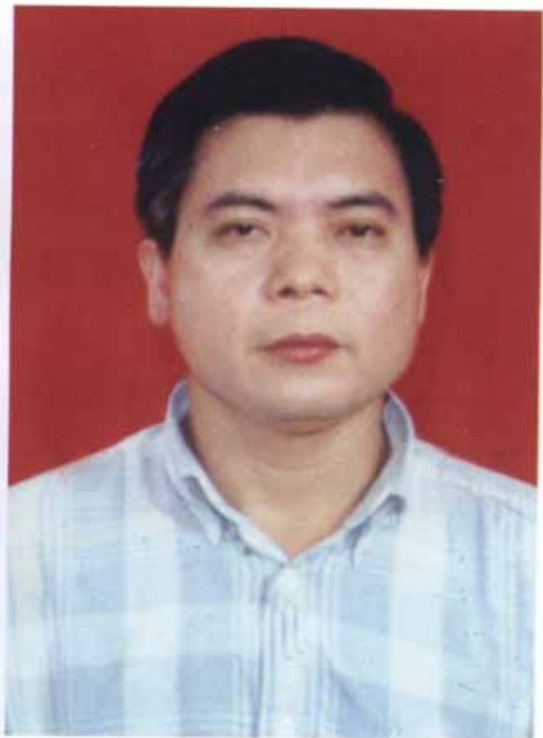
兴宁甘专国琪先生玉照 捐款叁仟元