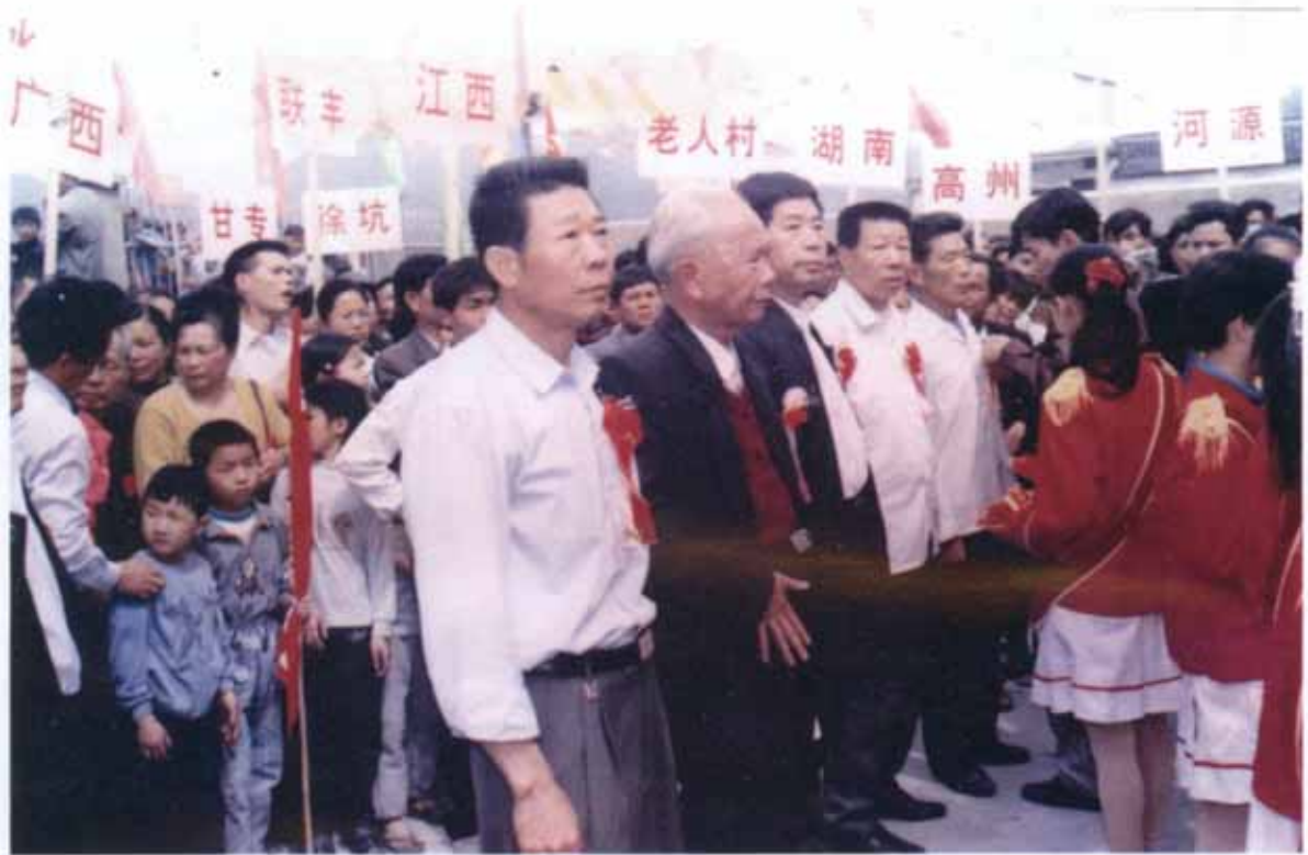
甘专村开基始祖元龙公祠重光庆典剪彩场面