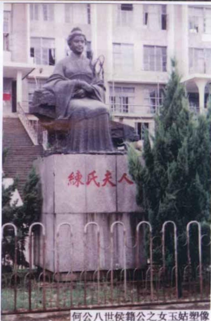
何公八世侯籍公之女玉姑塑像